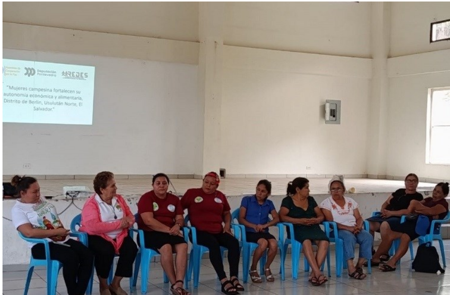
Grupo de mujeres de Berlín en una de las actividades del proyecto.

El año 2025 lo finalizamos en la delegación gallega de ACPP con la conclusión del proyecto “Mulleres campesiñas fortalecen a súa autonomía económica e alimentaria, Distrito de Berlín, Usulután Norte, El Salvador” que ha contado