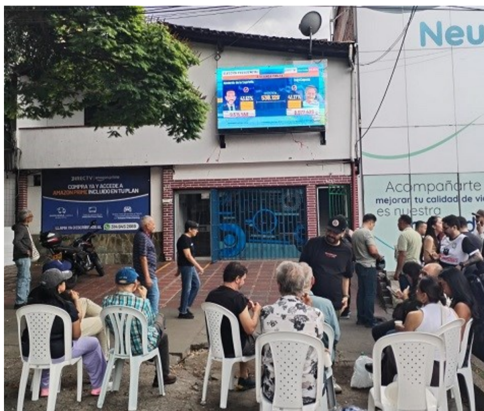
Seguimiento en la calle del recuento electoral.

Iván Cepeda representa la continuidad de buena parte de las políticas impulsadas por el actual gobierno de Gustavo Petro. Su propuesta se centra en la reducción de las desigualdades sociales, el fortalecimiento de los servicios públicos, la implementación de los acuerdos de paz, la defensa de los derechos humanos y la profundización de una transición energética orientada a disminuir la dependencia de los combustibles fósiles. Su trayectoria política destaca por su